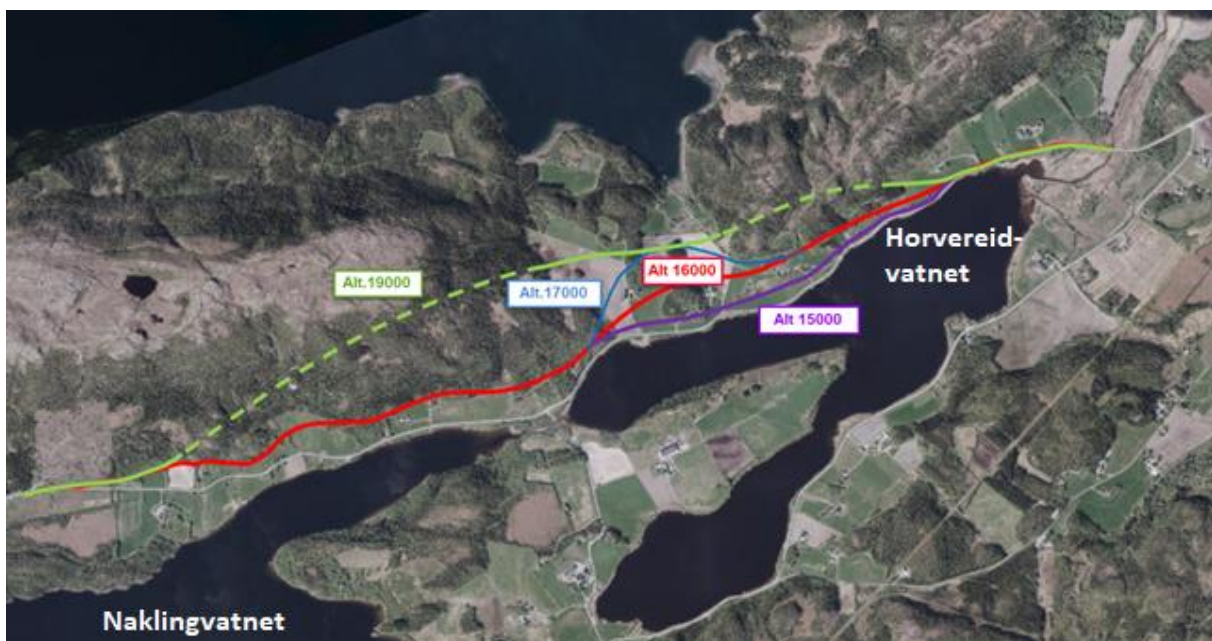
Figur 1: De opprinnelige 4 alternative traséene som vist i planprogrammet da det var på høring.

Planprogrammet som ble sendt på høring, inneholdt en beskrivelse av planområdet og hvilke overordnede rammer og premisser som gjelder for planarbeidet. De ulike alternativene for vegtraséer var presentert (4 ulike vegtraséer), samt hvilken metodikk som skulle benyttes ifbm. valg av trasé.